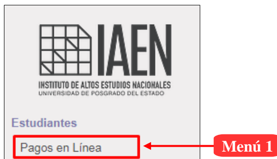
Ilustración 1: Estructura del menú para estudiantes

Una vez que se haya iniciado sesión en el sistema SIAAD, al estudiante se le mostrará el siguiente menú para acceso a la información de pagos: