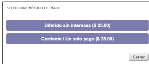
Ilustración 4: Métodos de pago

Los métodos de pago se visualizan después de pulsar Ir a pagar, las opciones variarán de acuerdo a las opciones por producto admitidas. El método que siempre se encontrara es el pago Corriente (Un solo pago).