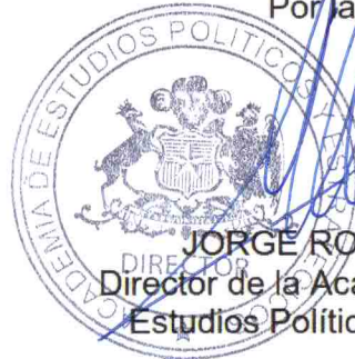
JORGE ROBLES MELLA Director de la Academia Nacional de Estudios Políticos y Estratégicos